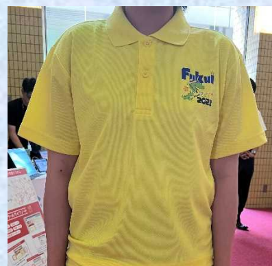
お揃いのスタッフポロシャツ